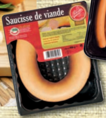
Saucisse de viande «la Lyoner» (LS)