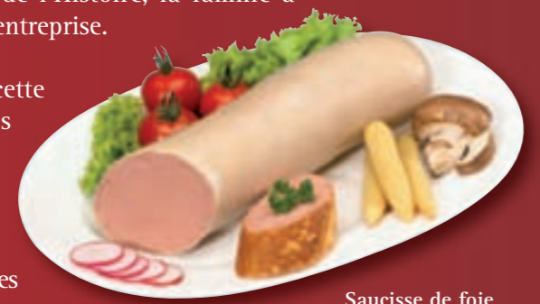
Saucisse de foie et veau (coupe)

Depuis 145 ans, sur cinq générations, cette entreprise familiale est devenue l'une des charcuteries les plus réputées d'Allemagne. Schröder a su se tailler une excellente réputation sur le territoire allemand et même au-delà des frontières, notamment en France, où les produits Schröder sont appréciés pour leur goût inimitable.