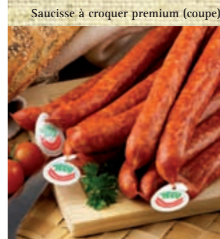
Saucisse à croquer premium (coupe)