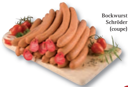
Bockwurst Schröder (coupe)