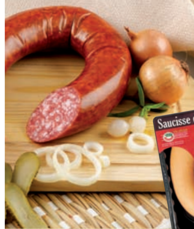
Saucisse à tartiner grosse (coupe)