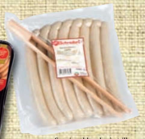
Saucisse blanche à griller avec pince (LS)